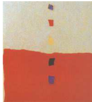
Testo critico di Maria Grazia Colombo

- Tavola Rotonda , Dicembre 2009 - Milano, Galleria Scoglio di Quarto.